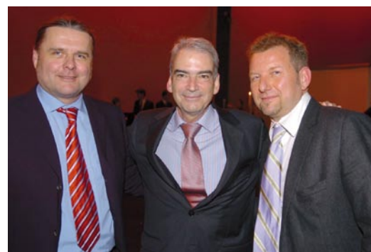
Effie-Preisverleihung 2006 in der Maag Eventhall Zürich.

von Agenturseite gleichermassen anerkannt ist, zweifellos als Königspreis der Branche bezeichnet werden. Denn hier wird offengelegt, ob das Zusammenspiel von Marketing und Kommunikation in hoher Qualität erfolgreich