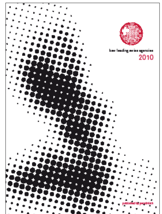
In Zusammenarbeit mit «persönlich»: das neue Porträtbuch 2010 des bsw.

Werbe-Auftraggeber haben die Gewissheit, mit einem Mitglied von bsw leading swiss agencies einen hochprofessionellen Kooperations- und Sparringpartner zur Seite zu haben, der ihnen dank erfahrenen, qua-